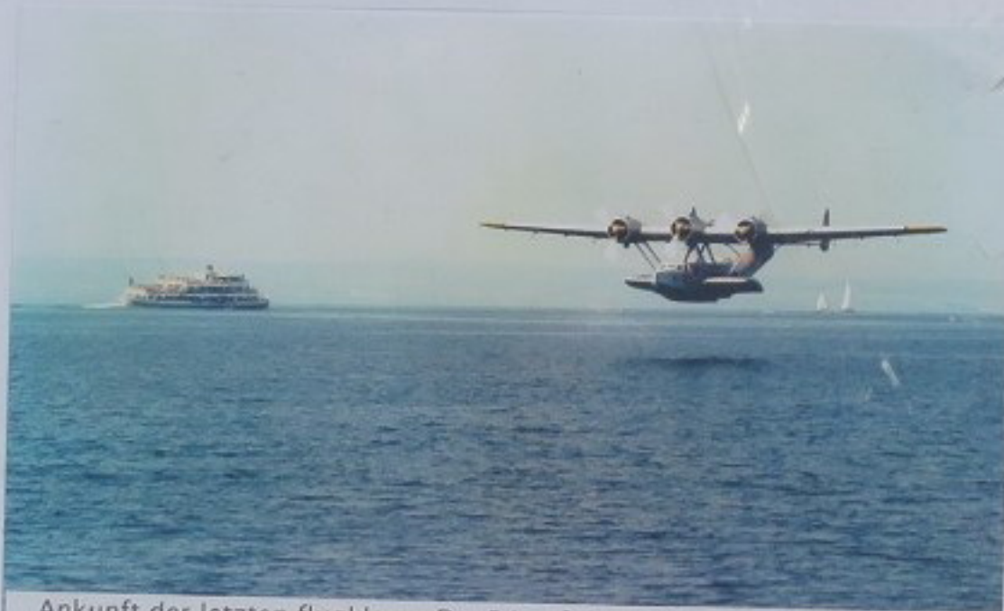
Ankunft der letzten flugklaren Do-24 auf dem Bodensee im August 1971

ROLF BREITINGER Eugenstr. 71/1 88403 FRIEDRICHSHAFEN Tel.: 07541 / 2 31 99