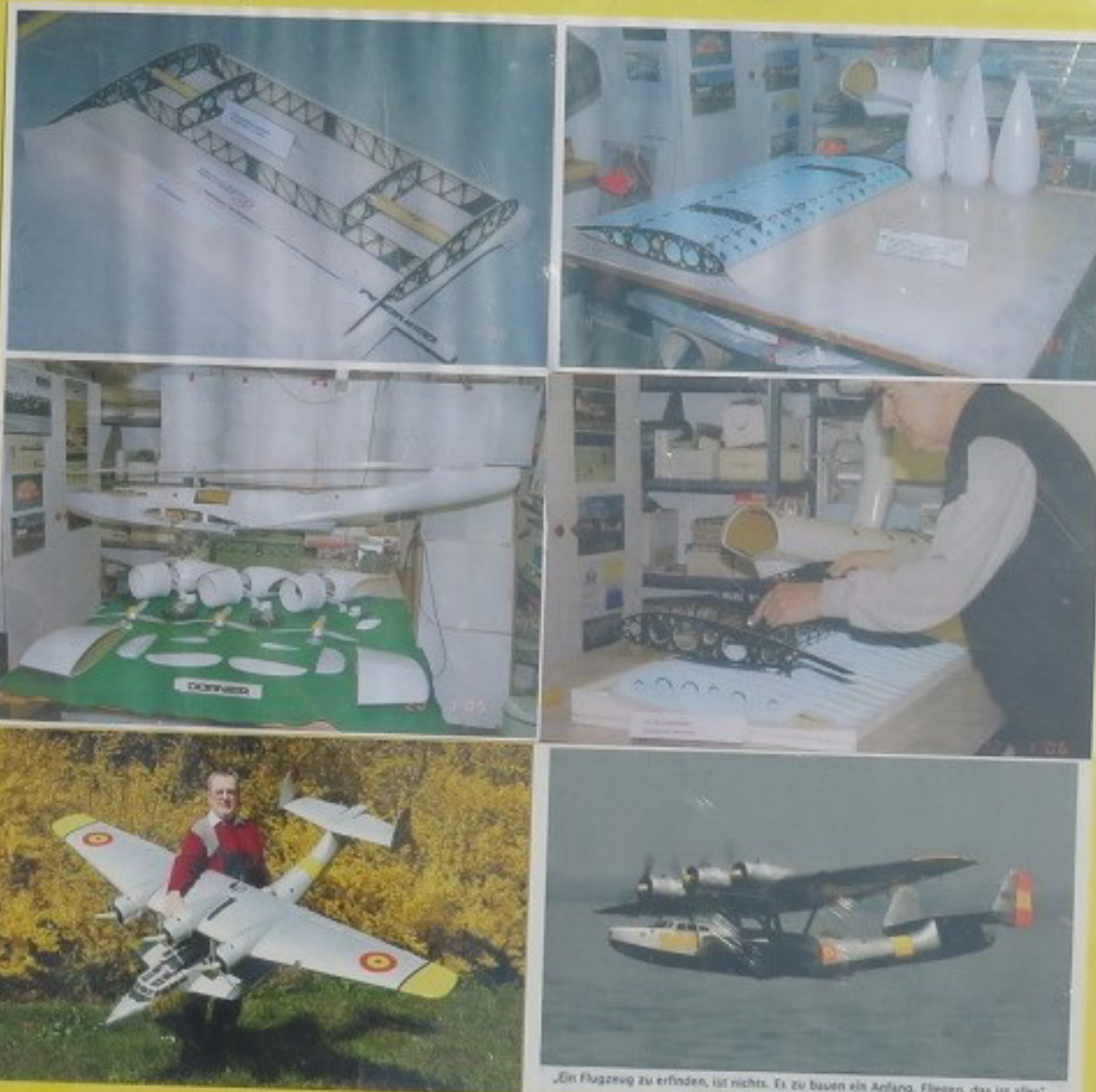
„Ein Flugzeug zu erfinden, ist nichts. Es zu bauen als Anfang. Fliegen, das ist alles“. Das U-Bootboot 1862 - 1991 deutscher Ingenieur und Piloten